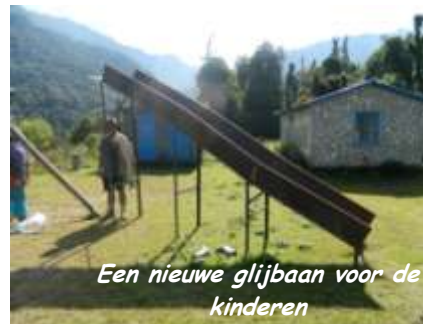
Een nieuwe glijbaan voor de kinderen