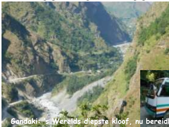
Gandaki: 's Werelds diepste kloof, nu bereikbaar, en hoe!

De volgende morgen regelt Paul een busje tot Beni, 2u over een bangelijke weg vol rotsen en putten (we zaten precies in een documentaire van Vranckx!) er wordt veel gegild, wat gebeden (en gegniffeld!)?