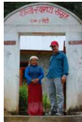
Grote baas op bezoek!