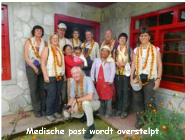
Medische post wordt overstelpt.

In Chitre blijven we 4 dagen, we bezoeken er het medisch centrum, tandartskabinet en labo en natuurlijk het schooltje... daar is er een soort "Vlaamse kermis" georganiseerd en moeten we zelfs deelnemen aan kampioenschappen touwtrekken (zie coverfoto) en stoelendans (de Belgen tegen de dorpsbewoners)