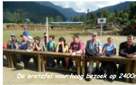
De eretafel voor hoog bezoek op 2400m