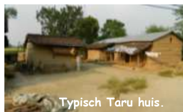
Typisch Taru huis.

schitterende tempels ter ere van Boeddha, daar gebouwd door boeddhisten uit de hele wereld) indrukwekkend is het wel, het domein is zo groot dat we er per riksja doorrijden. Vandaar maken we ook een uitstapje naar de grens met Indië, langs een smalle weg door eindeloze rijstvelden... een groene zee en ons busje wordt een bootje! Aan de grenspost zelf is niks meer over van de rust onderweg: het is er druk, ontzettend druk, mensen, fietsen, kinderen, beesten... wij kijken onze ogen uit en we worden ook bekeken! We gaan door naar het natuurpark in Chitwan, logeren er in een mooi hotel, verkennen de omgeving met buffel & kar en in de jungle op de rug van een olifant en op de rivier in een prauw! We zien heel wat vogels en wilde dieren ( neushoorn voor olifanten ... wat een ervaringen! Op 16/10 is het tijd om afscheid te nemen, Paul en Marc (de