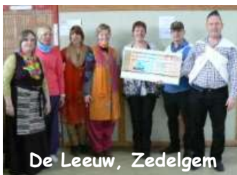
De Leeuw, Zedelgem

met jullie donaties precies allemaal gebeurt. De stille anonieme sponsors verdienen uiteraard onze dank maar ook de thans lopende schoolacties verdienen een dank-u-wel: De Sint-Rembert School in Torhout, Vrije BS De Leeuw in Zedelgem, de BS Oosterwijk in Westerloo en de Steinerschool in Assebroek-Brugge.