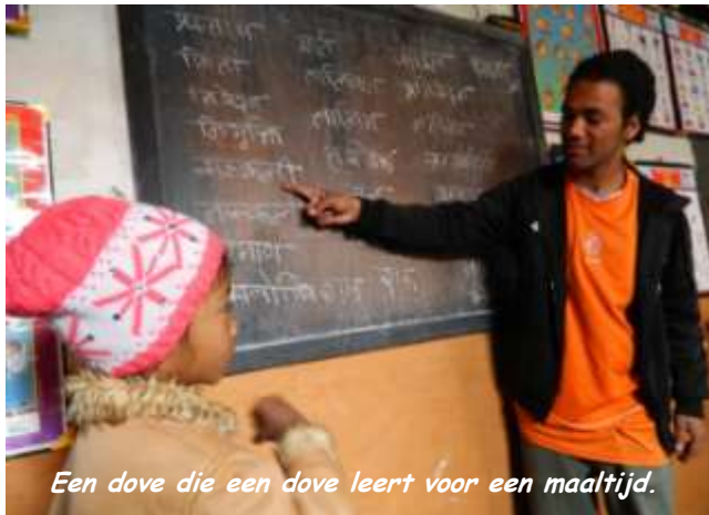
Een dove die een dove leert voor een maaltijd.

van de kindjes verblijft om voor haar en de andere kindjes de opvang te verzorgen terwijl haar man en haar andere kinderen 1 uur stappen verder op hun boerderijtje blijven wonen zijn. Ook deze mensen met weinig proberen alles te doen voor hun kinderen. Bewondering!