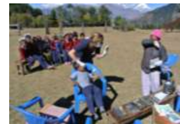
Gebitscontrole in volle zon!