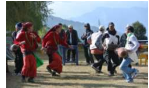
Traditionele openingsdans die alleen door mannen gedanst wordt!

jongeren die in het buitenland werken of in de grote stad studeren of wonen terug in hun eigen leefgemeenschap vertoeven. Het is ook de ideale kans voor de jongens en meisjes om elkaar te leren kennen, als u begrijpt wat ik bedoel. Een jeugdclub zal dan ook een goede aanwinst zijn om hun eigen activiteiten te ontwikkelen los van de weersomstandigheden en een stuk minder koud. Tijdens het jaarlijks festival kan het 's avonds