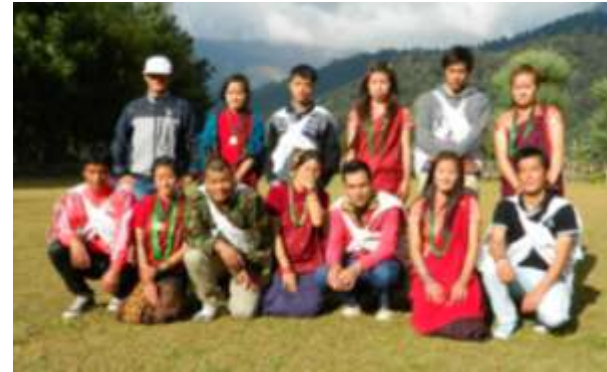
Een aantal leden van de Himalayan Youth Club