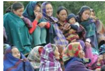
Door de kou zit iedereen knus bij elkaar met de nodige extra blankets.

laat immers al een stuk vriezen. Binnenkort dus heeft dit dorp alle minimum benodigde structurele basisvoorzieningen en eens het internet volwaardig beschikbaar is kunnen we hier afronden met het ombouwen van een oud traditioneel Magarhuis tot een