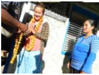
Twee nieuwe leraressen