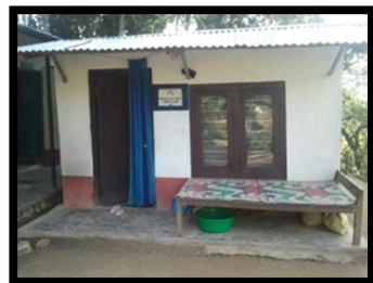
Leraarskamer of keuken?

kinderen, alle leergangen door elkaar, in één klas les volgen. In het andere lokaal slapen ze alle 25, samen met de leerkrachten. De leerkrachten zijn niet erkend en werken onbezoldigd. Ze krijgen enkel wat leefgeld van de ouders. Hier moet dus dringend een oplossing voor komen! Aan enthousiasme en opoffering is er echter geen gebrek!