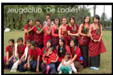
Jeugdclub 'De Ladies'

en opslagruimte en het installeren van speciale metalen scharnierende deur zodat het podium zowel naar buiten als naar binnen toe dienst kan doen.