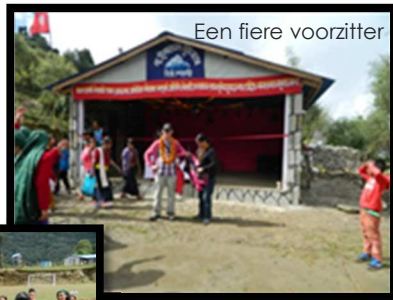
Een fiere voorzitter

De Himalayan Youth Club is nu de fiere eigenaar! Wij waren te gast voor de officiële opening.