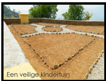
Een veilige kindertuin

Na contacten in België met de Kerun vereniging die vroeger ook al enkele projecten opzetten in Nepal, had ik het geluk dat twee vertegenwoordigers mij wilden vergezellen naar dit feest. De mooie en dankbare ontvangst van de lokale kinderen, bevolking en schoolstaf konden hen overtuigen om mee in dit verhaal te stappen zodat we de ganse school in één trek kunnen uitbreiden en renoveren. Met twee gaat het immers tweemaal zo snel. En met zo'n 130 nieuwe donateurs kan je het verschil zeker maken. De klassen werden binnenin met lakverf afgewerkt en warden zelfs beschilderd met permanente tabellen zoals het Nepalees en ons alfabet, getallenreeksen, enzovoort. Met de lakverf kunnen we eindelijk de muren afwassen en proper houden.