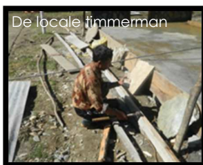
De lokale timmerman

Het dorp kreeg ook een weg die tot aan de school en het jeugdhuis reikt. Het is een uitgegraven zandweg die enkel in het droogseizoen berijdbaar is met jeeps en dus allesbehalve comfortabel is. Maar voor het leveren van goederen en de uitvoer van eigen kweekoverschotten is het voor de lokale bevolking toch veel interessanter geworden. Het is er ook niet druk (2 trucks of tractors en enkele moto's per week) zodat het trekkingstoerisme er niet te veel onder te lijden heeft. Gelukkig maar, want de weg ligt op één van 's werelds 10 mooiste wandeltochten.