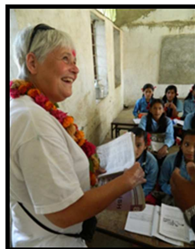
Hoog bezoek uit G.B.