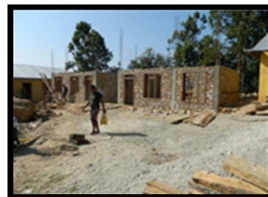
Ruwbouw eerste etage klaar

We hopen ook met individuele sponsors deze school inhoudelijk te versterken en het nodige educatief materiaal te voorzien. Alle beetjes helpen!