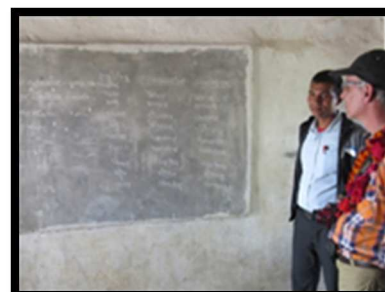
Weg met cementen borden