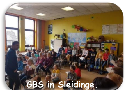
GBS in Sleidinge.