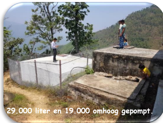
29.000 liter en 19.000 omhoog gepompt.