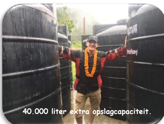
40.000 liter extra opslagcapaciteit.