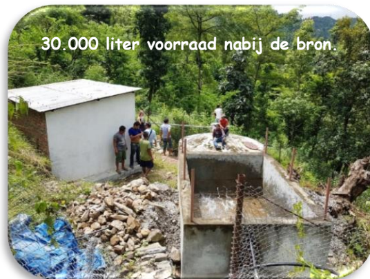
30.000 liter voorraad nabij de bron.

Intussen is het dorp, 4 jaar naar de verwoestende aardbeving en waarbij het ganse dorp zowat platgedrukt was, druk bezig hun huizen te herbouwen. Met een toelage van de overheid t.b.v. een schamele €2.400,00 (!?) en dus vooral met retributies van familieleden die in het buitenland werken ontspruiten er overal in het dorp eigentijdse huisjes. Klein wegens de centen en de overheidscontroleur die in ruil voor de subsidie heel wat bouwbeperkingen opgelegd. Het is even wennen aan de moderne - eerder saai - bouwstijl wat het 'Bokrijk'-gevoel die deze oude dorpen hadden geheel doet verdwijnen. Gelukkig versieren ze de gevels met bonte kleuren. Ook positief is dat ze eindelijk of beter sanitair binnenshuis en ook in de keuken een kookfornuis op gas met rookafvoer voorzien, wat de levenskwaliteit aanzienlijk verbeterd.