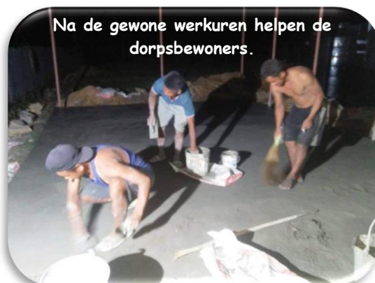
Na de gewone werkuren helpen de dorpsbewoners.