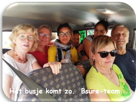
Het busje komt zo. Bsure-team.