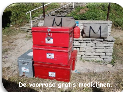
De voorraad gratis medicijnen.

Met ons team en tal van lokale spontane vrijwilligers, soms medisch getraind, behandelden we zo'n 3000 patiënten in 6 dorpen waarbij we 4800km reden waarvan 2800km off-road (XL).