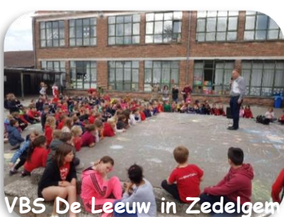
VBS De Leeuw in Zedelgem

Dit jaar waren we ook te gast in onder meer de Torhoutse Sint-Rembertschool, de GBS De Mozaïek in Roosbeek-Boutersem, de VBS De Leeuw in Zedelgem en de GBS in Sleidinge en te Sint-Michiels. Want ook bewustmaking hier te lande is belangrijk. Voor geïnteresseerden kijk eens op onze site via deze link: http://himalayanprojects.brugseverenigen.be/ActiesinBelgi/Educatiefenactiemateriaal voor een volledig overzicht van ons aanbod.