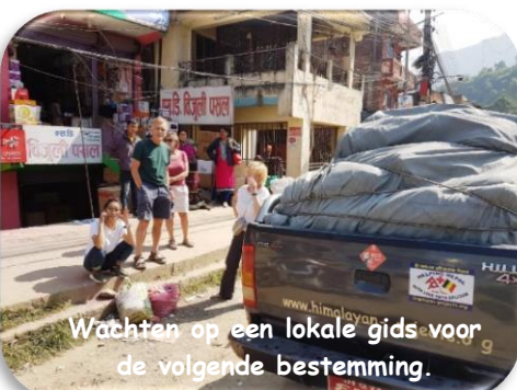
Wachten op een lokale gids voor de volgende bestemming.