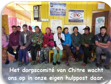
Het dorpscomité van Chitre wacht ons op in onze eigen hulppost daar.