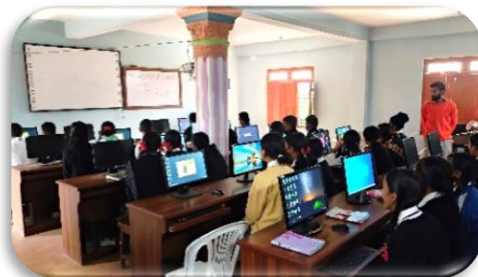
Gauri Shankar Sec. School.