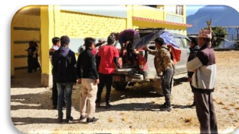
Shree Jayanti Sec. School.