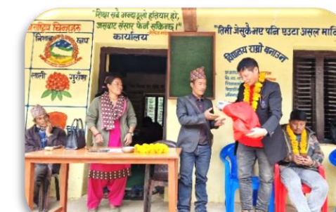
Shree Saraswati Sec. School.