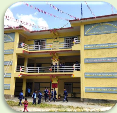
Ambika Secondary School:

Komen o.m. aan bod: Plechtige inhuldiging van de Bhakimele Secondary School: