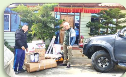
Waterproject en meer: