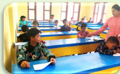
Start Kind-, Familiezorg- en Trainingscentrum in Suikhet: