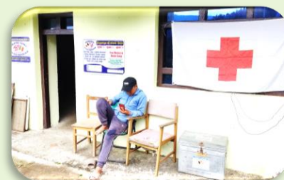
Gunsha hospitaal van nieuw materiaal voorzien: