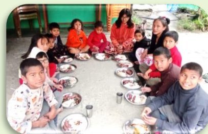
Op de valreep: Medisch Kamp